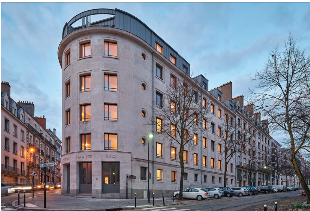
Latitude Architectes © Jérôme Pallard