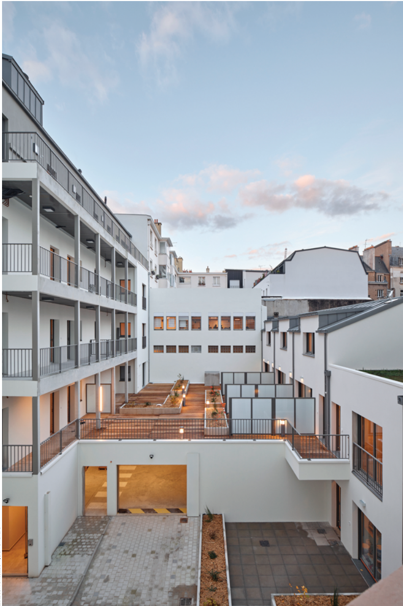
Latitude Architectes

Cette restructuration avec surélévation bois d'un bâtiment de bureaux appartenant à l'État en logements (social et standing) préfigure les projets de demain : en effet, au-delà de sa qualité environnementale, cette transformation d'usage a permis de produire, en concertation avec les riverains, des logements en zéro artificialisation nette.