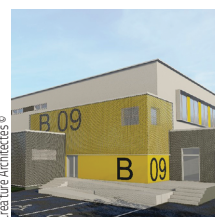
Créature Architectes ©

Spie batignolles Grand Ouest Gymnase universitaire, Poitiers