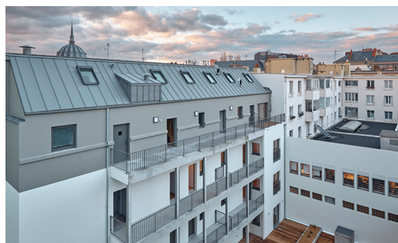
Latitude Architectes

« ...En phase concours, nous sommes partenaires et travaillons main dans la main pour gagner [...] mais notre avis compte aussi en phase réalisation, l'entreprise sait écouter. »