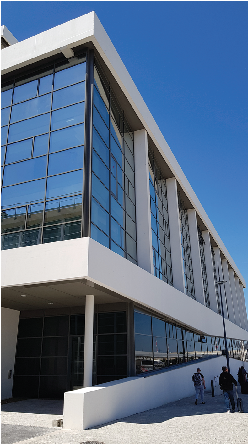
MAP Architecture © Spie batignolles

O opération de conception-construction du nouveau bâtiment du personnel de l'aéroport, caractérisée par la flexibilité des plateaux et la modularité des bureaux. Le bâtiment est totalement intégré au site.