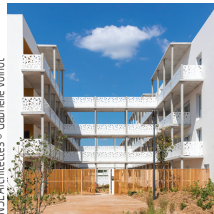
NSL Architectes

Bec Construction Provence 98 logements collectifs, La Vidaubanaise, Vidauban