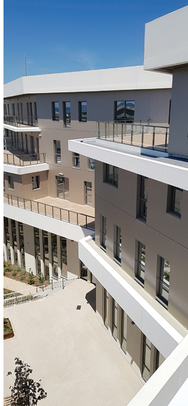
MAP Architecture © Spje batignolles

« En résumé, une équipe soudée et motivée au service du confort et de la qualité de vie au travail des futurs occupants de ce bâtiment ! »