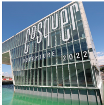
Archi : Corinne Vezzoni & associés

Eiffage Construction Centre d'interprétation de la grotte Cosquer (Villa Méditerranée), Marseille