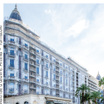
Maîtrise d'œuvre: Atelia

Bec Construction Provence 98 logements collectifs, La Vidaubanaise, Vidauban