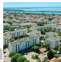
B4 Architecture/Sartorius/Architecte

Dumez Côte d'Azur Réhabilitation et extension de l'hôtel Carlton, Cannes