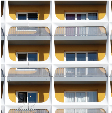
Form Architecture