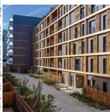
Atelier 5 Proof / Agence Enrico Heuvel © Graphix

GTM Bâtiment Jaurès-Petit, construction et réhabilitation de logements, Paris 19 e