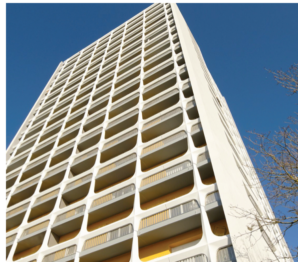
Form Architecture © TDR