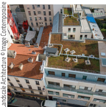
Landescale Architecture

Fayat Bâtiment Réhabilitation commerciale et construction de logements, Paris 14 e