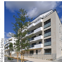
Architecte : Urbanité - Marc Faury

Eiffage Construction Résidentiel Construction de logements, Botanik, Châtenay-Malabry