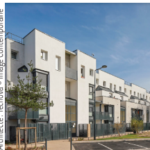
Architecte : Ternoou

Léon Grosse Construction Rénovation de 191 logements, Clichy-sous-Bois