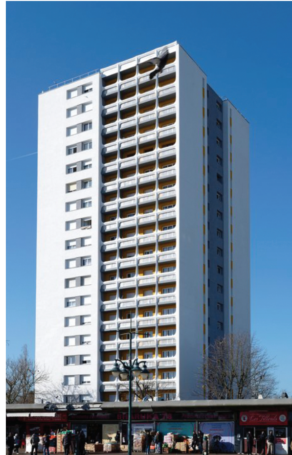
Form Architecture

Maître d'ouvrage : Foncia Maître d'œuvre : Form Architecture Bureau d'études : Elan Exploitant : Idex Principaux partenaires sous-traitants : Firza – ESS (Mantes-la-Jolie) – Luigi Plomberie – Soprema Montant : 2,9 M€ Livraison : février 2022