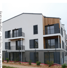
Atelier M3 Architecture

Léon Grosse Construction 92 logements, Taverny