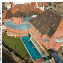
Chartillon Architectes: TNA

Eiffage Construction Bains municipaux, Strasbourg