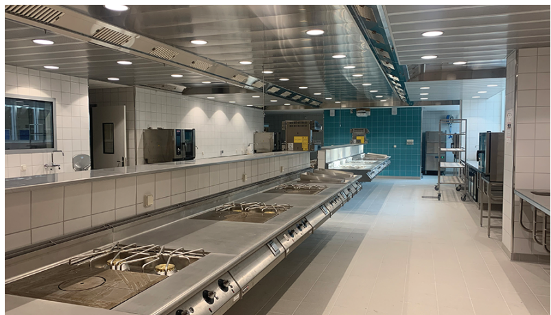
Architecte: Rey de Crécy