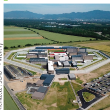
Architecte: SCAU

Léon Grosse Établissement pénitentiaire, Lutterbach