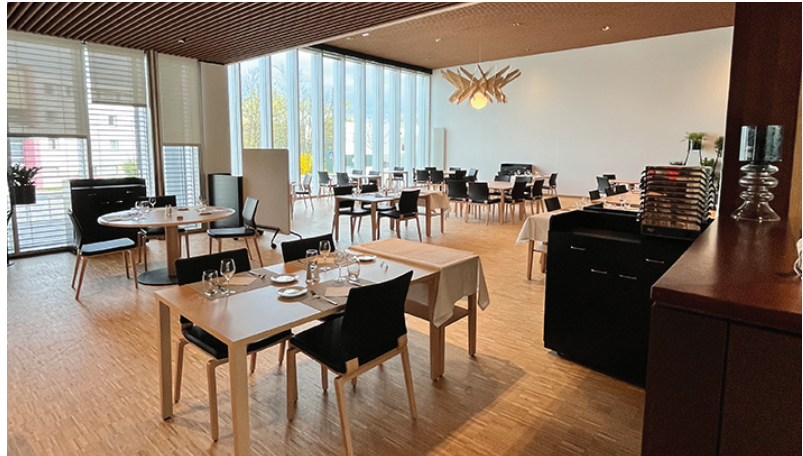
Architecte: Rey de Crécy

« Faisant suite à la construction d'un premier bâtiment neuf, l'extension et la restructuration lourde du plateau technique (tranche 2) en est l'intervention majeure et de loin la plus délicate en termes de phasage et d'ingénierie. Lorsqu'on commence un chantier de plus de trois ans en site occupé, il est fondamental de mettre en place un environnement de travail qui permette à tous les interlocuteurs, maîtrise d'ouvrage, maîtrise d'oeuvre, utilisateurs, entreprises, d'avancer en confiance à tous les stades du projet. De la même manière, la qualité des espaces dans les restaurants avec des mobiliers complexes, habillages muraux spécifiques et innovants, a pu être garantie grâce à un engagement et une collaboration forte entre les différents acteurs. »