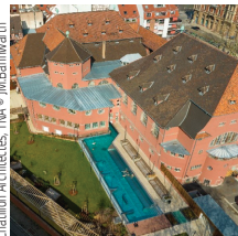
Chablon Architectes, TMA

Eiffage Construction Bains municipaux, Strasbourg