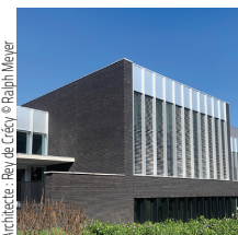
Architecte : Beau de Crécy

Bouygues Bâtiment Nord-Est Complexe pour Grand Nancy Thermal