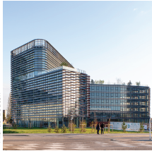
Architectes : Osso/Art&Build

Demathieu Bard Construction Immeuble de bureaux Osmose, Strasbourg- Wacken