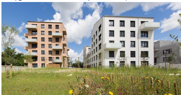
Atelier Pascal Gontier/Bouygues Bâtiment

Bouygues Bâtiment IDF pour «Les jardins de Stains»