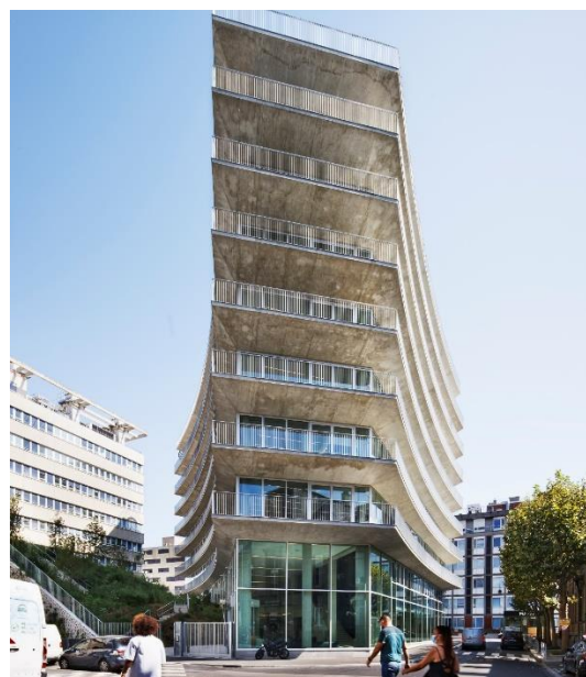
Chartier Dalix/CBC/Photo C. Gharbi

Retrouvez tous les prix régionaux et nationaux sur notre site