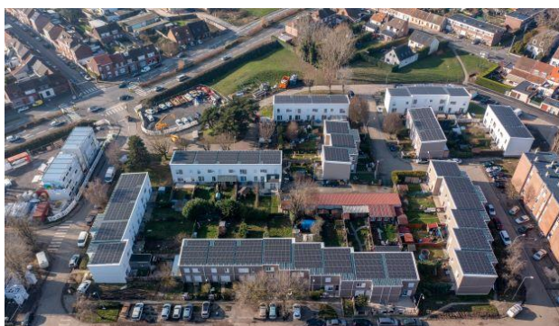
Red Cat/Nortec/Rabot Dutilleul (EnergieSprong)/Photo F. Cocatrix

Rabot Dutilleul Construction pour la réhabilitation de 160 maisons à Wattrelos