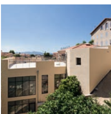
Architecte : Patrick Banchélin