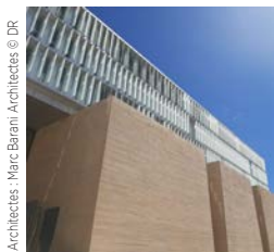
Architectes : Marc Barani Architectes