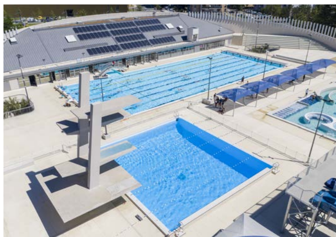
Architectes : Soho Atlas