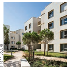
Architectes : KERN et Associés