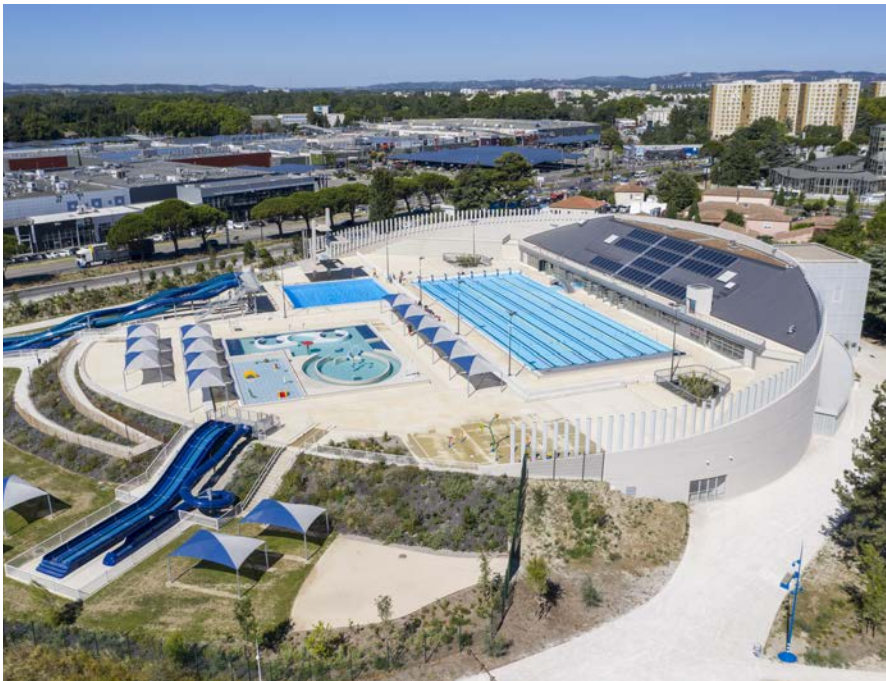
Architectes : Soho Atlas

O pération de réhabilitation complète du stade nautique d'Avignon, classé bâtiment remarquable du XXème siècle, et de remodelage des 3 bassins extérieurs existants, avec création d'un Spa Bien Être. Cette restructuration s'est accompagnée d'une mise aux normes accessibilité et sûreté de l'ensemble du site et de ses bassins. Plus de 3000 heures d'insertion ont été réalisées, correspondant à 160% des objectifs, et 56% des besoins chauds ont été produits par des énergies renouvelables (géothermie et panneaux solaires thermiques). Le maximum de matériaux de démolition a été réemployé.