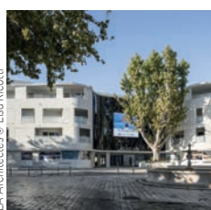
LLA Architectes © Lisa Ricotti