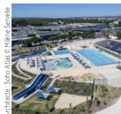
GCC Provence Ensemble immobilier Îlot Cascade, Martigues

Architecte : Soho Atlas