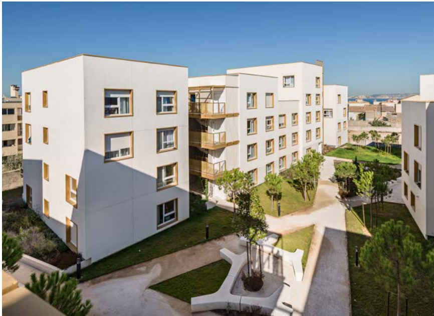
Architectes : Kern & Associés

O pération de démolition d'un ancien foyer social de 235 logements répartis sur 3 bâtiments et construction d'une nouvelle résidence sociale de 230 logements répartis sur 5 bâtiments en contrat de conception-construction. Le projet s'est inséré harmonieusement dans son contexte, caractérisé par un tissu urbain à dominante pavillonnaire, héritage de la présence de noyaux villageois, devenus faubourgs puis intégrés à la ville. Ces caractéristiques de village constituent la singularité du lieu, et le projet en tire parti pour réussir son insertion dans ce site d'exception, véritable interface entre ville et plage. En cela, il est en nette rupture avec le programme de type barres qui occupait la parcelle et qui a été intégralement démolé.