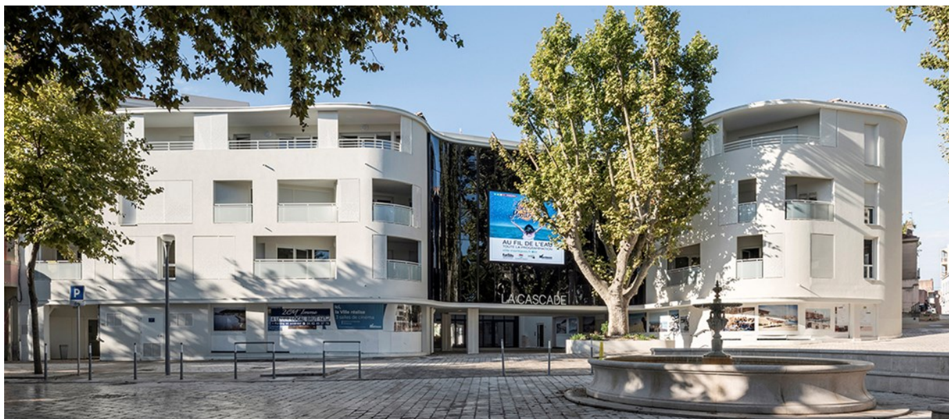
Architectes : Patrick Banchelin

M ontage immobilier complexe comprenant la conception-réalisation de logements, commerces, parking et salles d'art et essai en plein centre-ville de Martigues. La construction de cet îlot multi-produits, avec deux maîtres d'ouvrage différents, a reçu le label NF HABITAT HQE – CERQUAL et a fait travailler 48 sous-traitants dont 98% étaient originaires des Bouches du Rhône.