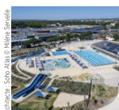
Architecte : Soho Atlas