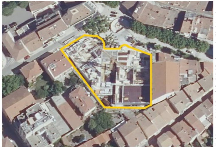
Architectes : Patrick Banchelin