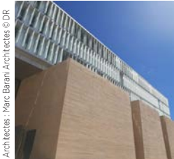
Architectes : Marc Barani Architectes