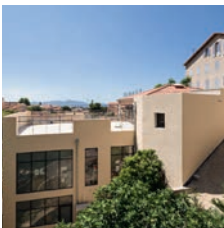
Architecte : Patrick Banchelin