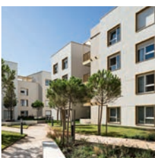
Architectes : KERN et Associés © Jean Bouvier