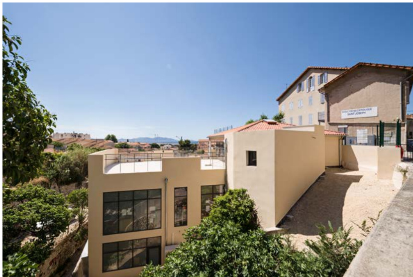
Architectes : Patrick Banchelin