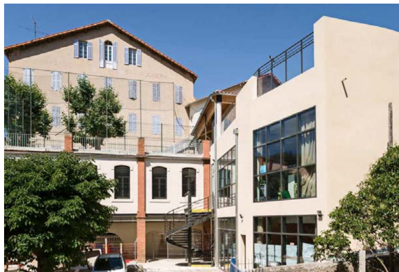
Architectes : Patrick Bachelin

A grandissement et la restructuration de l'école catholique Saint-Joseph de l'Estaque en site occupé. Une opération loin d'être simple, nécessitant de fortes compétences en matière de synthèse technique, de prise en compte des impératifs de l'école et d'organisation des phases délicates pendant les vacances scolaires. Le challenge majeur était de concilier le travail en site occupé et le chantier, sans accroc ou inconfort pour les occupants, dans un très vieux bâtiment (construit en 1894) où des risques d'effondrement sont apparus au cours des travaux.