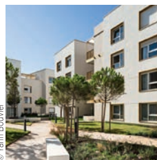
Travaux du Midi Résidence sociale Adoma, Marseille