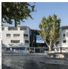
GCC Provence Ensemble immobilier Îlot Cascade, Martigues