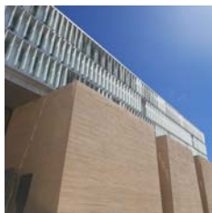
Fayat Bâtiment Cité judiciaire, Aix-en-Provence