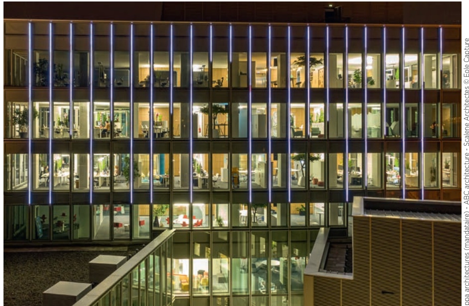
ppa architectures (mandataire) - ABC architecture - Scalene Architectes

Hervé Saintis , architecte, ABC Architecture