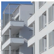
Architecte: Atelier Lion

Demathieu Bard Construction Résidence Les Ailes de Montaudran, Toulouse