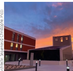
Architecte: Séquences

Demathieu Bard Construction Résidence Les Ailes de Montaudran, Toulouse