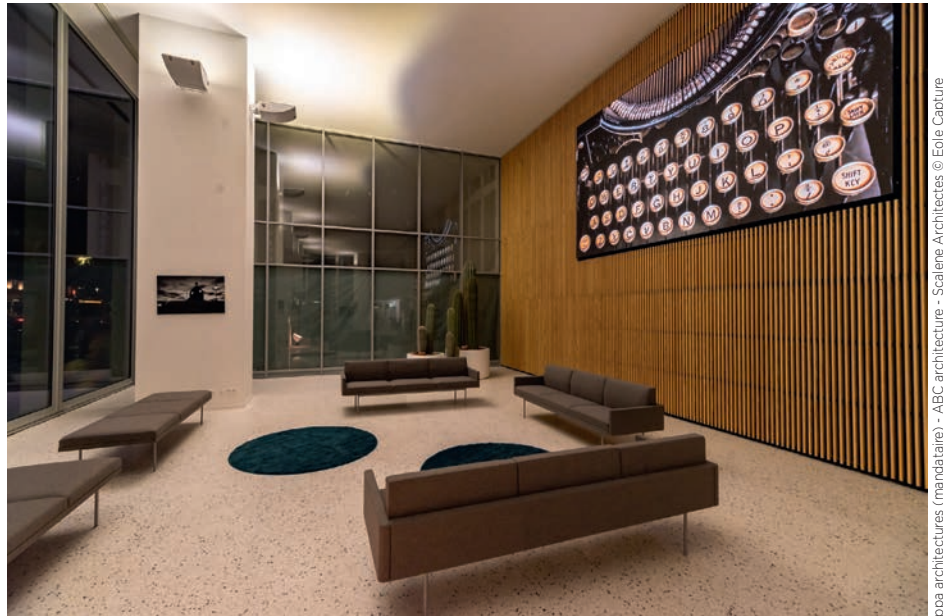
ppa architectures (mandataire) - ABC architecture - Scalene Architectes