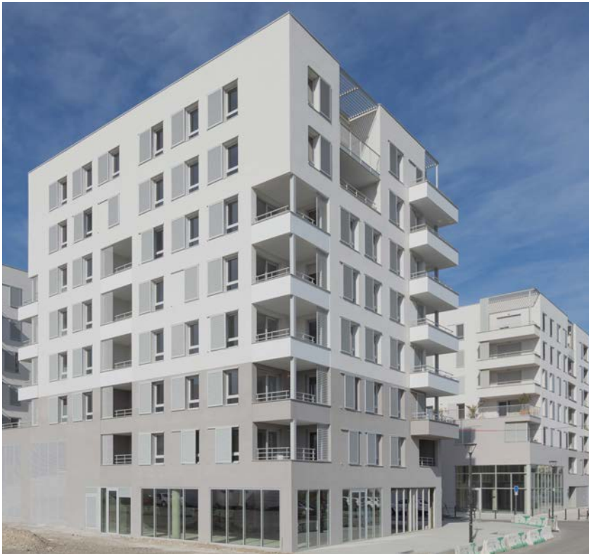
3.40Z(FN0F)W. 3.FVWMB->lg Y 5EY(Fbzafa . 5Z4(afazWB55:

O opération en entreprise générale de 2 bâtiments de 61 logements collectifs, réalisés en 17 mois tout compris, dont 2 mois de préparation (RT 2012 -13.5 %). Les deux constructions sont reliées par un socle au toit végétalisé avec 2 niveaux de parkings aériens. Des creux en façade et des angles d'immeuble évidés forment des loggias et des balcons généreux. Un encadrement spécialisé en corps d'état techniques a été mis en place pour assurer un délai plus court qu'en corps d'état séparé, tout en respectant la qualité architecturale des ouvrages. Cette équipe a piloté les 24 entreprises partenaires, dont 95% étaient régionales. Elles ont été associées dès les premières mises au point techniques. Une charte partenariale, avec les entreprises sous-traitantes partenaires, a été mise en place autour de valeurs partagées à cet effet. L'entreprise générale a assuré le tri sélectif des déchets avec suivi en filière de traitement tout au long du chantier.