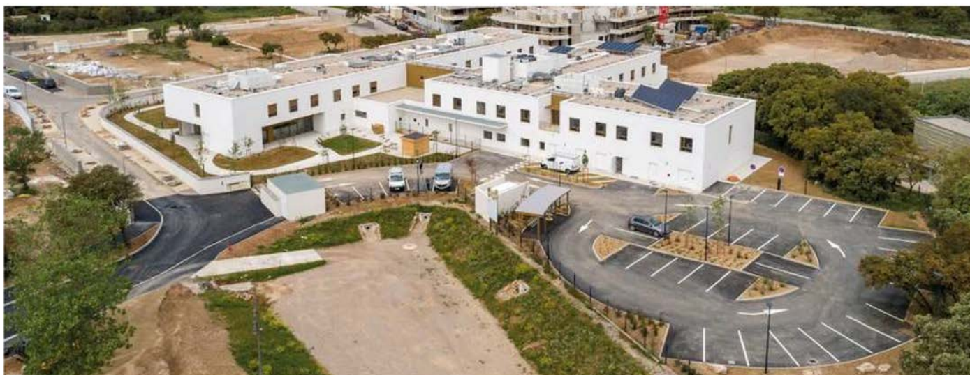
Architectes : Marc Mimam, DPLG architecture