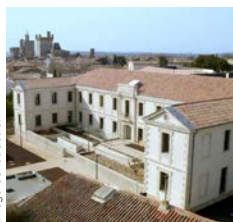
Eiffage Construction Internat et réfectoire des lycées Gide et Guynemer, Uzès