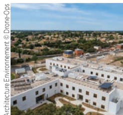
Eiffage Construction Languedoc Ehpad et Pasa (Pôle d'activités et de soins adaptés), Baillargues