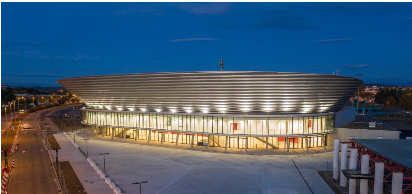
Architectes : Marc Mimram, DPLG architecture

O opération majeure pour la ville de Narbonne, l'Aréna de Narbonne a été réalisée en un délai record de 19 mois : 6 mois pour la conception, 13 mois pour la construction. Pour relever ce défi, l'entreprise a notamment recouru au Lean management et au BIM et établi une collaboration très étroite avec tous les acteurs du chantier. Mais l'opération cumule d'autres performances : le respect de l'environnement avec 89% de déchets de construction valorisés, 0 accident à déplorer malgré le délai de construction ultraserré, 13 121 heures d'insertion, 17 PME occitanes (dont 10 de Narbonne) attributaires d'un lot sur les 23 que comptaient les travaux et une communication régulière vis-à-vis des Narbonnais sous forme notamment d'une newsletter.