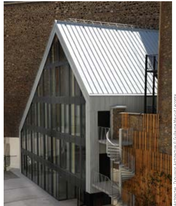
Architectes : Dubuisson Architecture

La maîtrise d'œuvre et les équipes chantier ont pu se concentrer pleinement sur les études et l'exécution du projet avec efficacité. La tenue du planning, délicate pour cette opération, s'est faite par accélérations régulières et a permis une livraison dans de bonnes conditions sans surcharge de travail. »