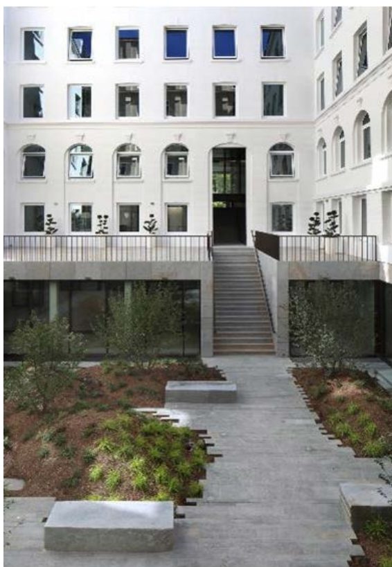
Architectes : Dubuisson Architecture

C e projet, d'une grande complexité, rassemble tout le savoir-faire du métier d'entrepreneur général en matière de restructuration lourde. L'exploit réside dans la valorisation d'un bâtiment ayant une histoire et un patrimoine, tout en y associant des touches de modernité à travers une architecture soucieuse de protéger l'existant. Des solutions nouvelles ont été apportées à l'édifice, afin de lui donner plus de lumière, de transparence et de confort, et cela en préservant son âme et son passé