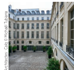
Architectes : Calo © Michaël Tubiana

Bouygues Bâtiment Île-de-France Auberge de jeunesse « Les Piaules », Paris XII e