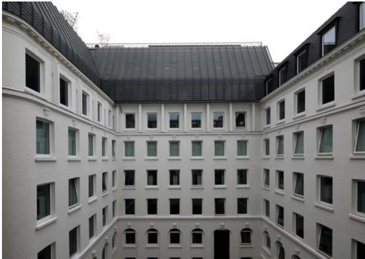
Architectes : Dubuisson Architecture