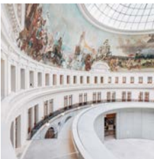
Architectes : Tadao Ando, Niemi, P.-A. Gattler

Bouygues Bâtiment Rénovation Privée Bourse de Commerce, Pinault Collection Paris I er