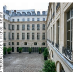
Architectes : Cabé © Michael Tubiana