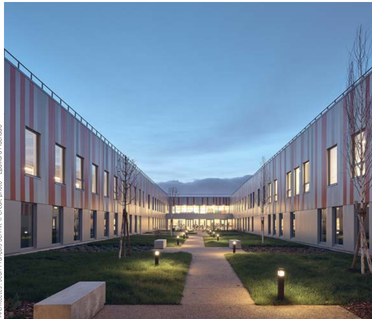
Architectes : Jean-François Schmit