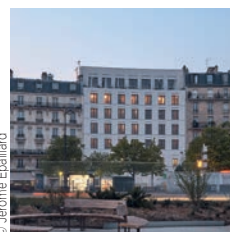
Architectes : JBKN - Pelegrin

7 rue de Madrid, bureaux de haut standing, Paris VIII e