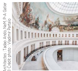
Architectes : Tadeo Ando, Niemi, P.-A. Gattler

Bougues Bâtiment Rénovation Privée Bourse de Commerce, Pinault Collection Paris I er