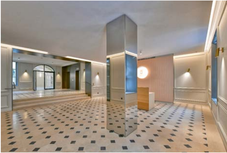
Architectes : Calq