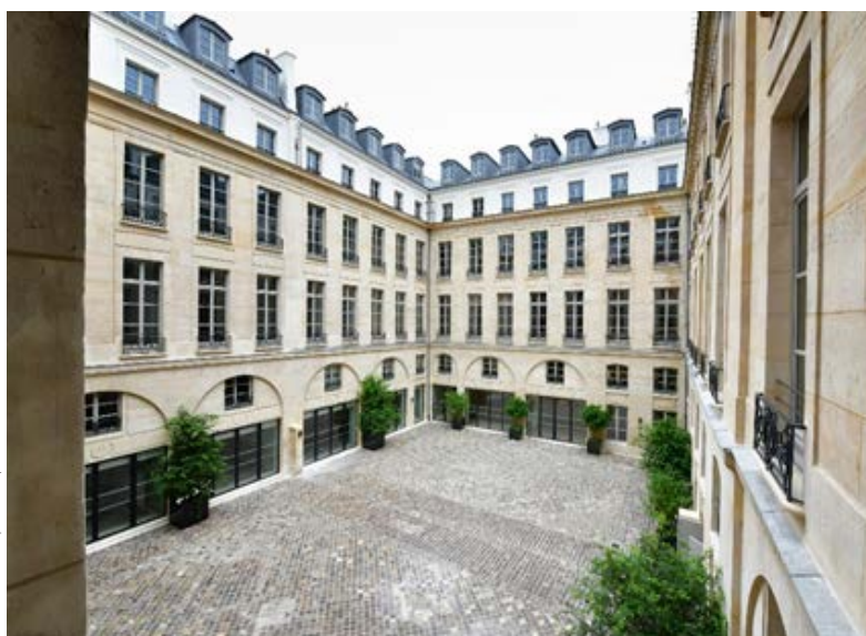
Architectes : Calq

Le Carré Concorde est un projet de restructuration de deux hôtels jumeaux du 18ème siècle en bureaux haut de gamme. Le projet, d'une grande complexité, rassemble tout le savoir-faire du métier d'entrepreneur général en matière de restructuration lourde. L'exploit réside dans la valorisation d'un bâtiment ayant une histoire et un patrimoine, tout en y associant des touches de modernité à travers une architecture soucieuse de protéger l'existant. Des solutions nouvelles ont été apportées à l'édifice afin de lui apporter plus de fluidité de circulations grâce à la création de gaines d'ascenseurs et de noyaux d'escaliers. Le projet s'accompagne d'une démarche environnementale, en visant plusieurs labels et certifications : démarche HQE® - Bâtiments tertiaires renouvelés - 2015 Passeport Excellent, WiredScore Gold, Label Effinergie, Breeam Excellent, RT 2012.