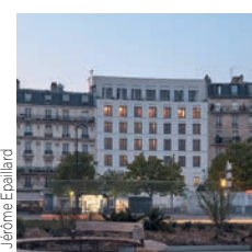
Architectes : JBMM - Pelegrin

Dumez 7 rue de Madrid, bureaux de haut standing, Paris VIII e