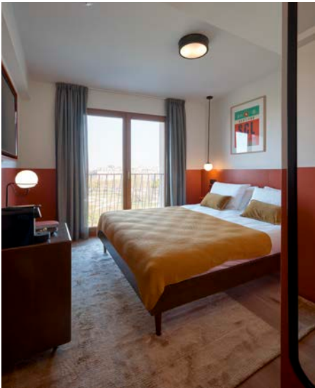
Architectes : JBMN - Pélegrin © Jérôme Epailard