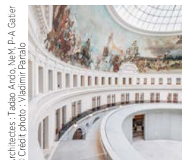
Architectes : Tadao Ando, Niemi, P-A Galier

Bouygues Bâtiment Rénovation Privée Bourse de Commerce, Pinault Collection Paris 1 er