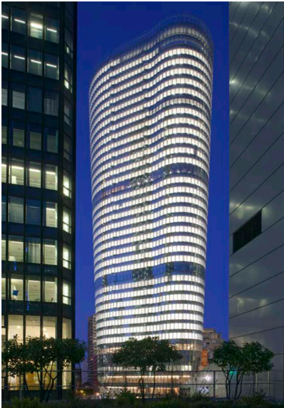
Architectes : Atelier Nuel - © A. Da Silva/Graphic-images

H aute de 150 mètres (38 étages de bureaux), la Tour Alto est une structure hors norme qui s'apparente à un ouvrage de génie civil. Elle se démarque notamment par sa façade, habillée d'une robe d'écailles de verre, et par sa forme évasée qui fait varier sa surface de 700 m 2 au pied de la tour à 1800 à son sommet ! Les formes de la tour répondent aux fortes contraintes spatiales du site, avec l'objectif d'utiliser au maximum l'espace disponible et les possibilités offertes par le Plan local d'urbanisme. Compte tenu de cette exiguïté du site et des contraintes de circulation, les différents phasages du chantier ont été mis au point dès la phase de conception. Les façades ont évidemment été modélisées pour optimiser le nombre de familles de châssis et industrialiser au mieux les process de fabrication et de pose.