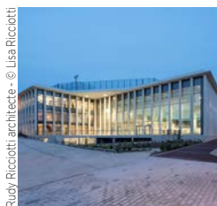
Rudy Ricciotti architecte

Leon Grosse Complexe sportif Alain Mimoun Rueil-Malmaison