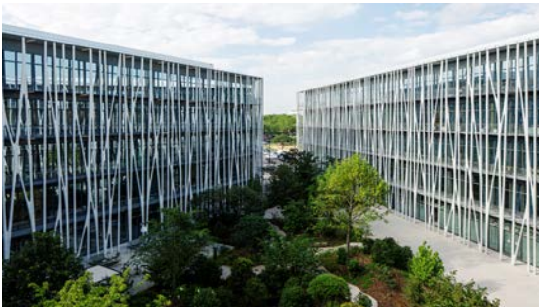
Architecte : Rudy Ricciotti

L e 19M - 19 pour 19ème arrondissement et M pour Manufacture de la Mode a été édifié à la gloire des métiers manuels pour la maison Chanel. Le bâtiment, conçu par l'architecte Rudy Ricciotti, intègre une enveloppe extérieure remarquable constituée d'un exosquelette en béton, servant d'écrin aux artisans travaillant dans les ateliers. La construction d'un témoin, aux dimensions exceptionnelles, a été nécessaire pour y parvenir. Ce support a aussi joué le rôle d'une salle de classe pour une école d'architecture de décoration intérieure des Maisons d'art. Les 45 000 m 2 de surface se déploient autour d'un patio central végétalisé. L'ouvrage est certifié NF HQE niveau excellent, et a obtenu les labels Bream International niveau Excellent, Effinergie+, Leed et BiodiverCity Construction.