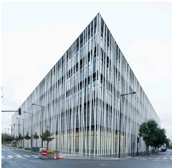
Architecte : Rudy Ricciotti