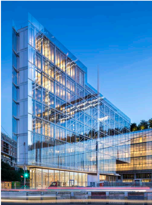
Architecte : Renzo Piano Building Workshop

La conception de la Maison de l'Ordre des Avocats repose sur la recherche d'une grande transparence architecturale, expression d'une justice démocratique. Marquée par de très fortes contraintes de la parcelle allouée, l'opération a nécessité une approche multidisciplinaire et l'utilisation du BIM. La maquette numérique a également permis de réduire les risques liés aux tâches particulièrement complexes. De nombreuses solutions techniques ont été développées sur mesure pour le projet, telles qu'une formulation spécifique des bétons ou encore une qualification particulière pour l'exosquelette. La façade double peau ventilée a été développée sous Atex. Le chantier, qui visait 5% d'heures d'insertion, en a atteint 6,2%. Une démarche de chantier à faibles nuisances a été mise en œuvre et les déchets de chantier ont été suivis et valorisés à hauteur de 88%.