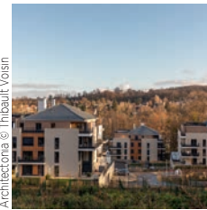
Architectonika © Thibault Voisin

Leon Grosse Complexe sportif Alain Mimoun Rueil-Malmaison