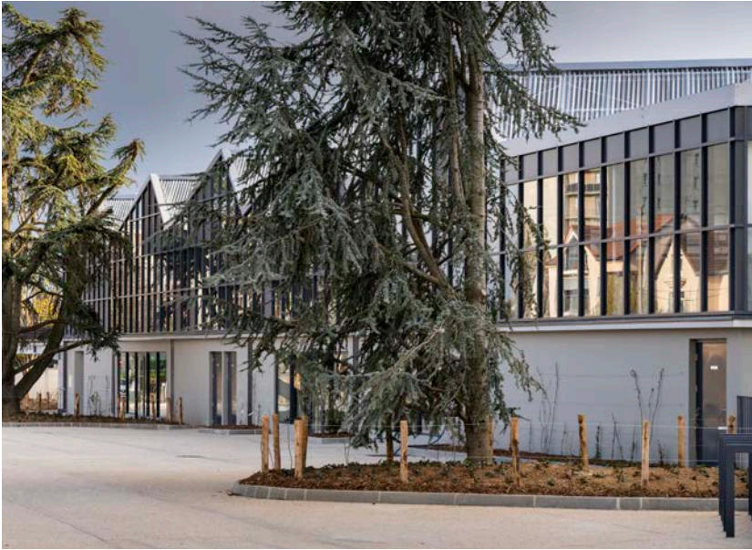
Architectes : Greig & Stephenson / Groupe Synthèse