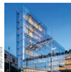
Renzo Piano Building Workshop

Bouygues Bâtiment Île-de-France Tour Alto, La Défense, Courbevoie