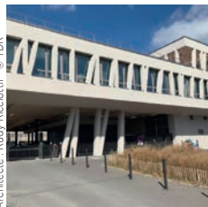
Architecte : Rudy Ricciotti

Fayat Bâtiment Île-de-France Manufacture de la Mode, Aubervilliers