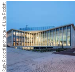
Rudy Ricciotti architecte

Leon Grosse Complexe sportif Alain Mimoun Rueil-Malmaison