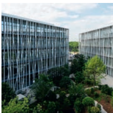
Architecte : Rudy Ricciotti

VINCI Construction France - Petit Maison de l'Avocat, Paris (XVII e )