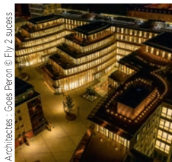
Architectes : Gossé Peron

Bouygues Bâtiment Île-de-France Le Clos des Vignes, L'Étang-la-Ville