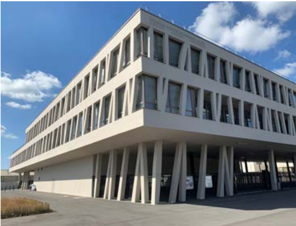
Architecte: Rudy Ricciotti - © TDR

Le collège Josette et Maurice Audin est un ouvrage réalisé en conception-réalisation qui repose sur une innovation : l'utilisation de béton de chanvre. Ce collège de 26 salles d'enseignements est le premier bâtiment d'une telle dimension à avoir utilisé cette technique en France. L'ouvrage a été conçu pour des coûts de gestion optimisés en énergie, eau et maintenance. Conçu en 2014/2015, il a obtenu la certification HQE et le label Biosourcé niveau 1, un label nouveau à cette époque. En parallèle, sa conception a été pensée pour un confort optimisé au plan hygrométrique, acoustique, visuel et olfactif.