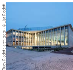
Rudy Ricciotti architecte

Leon Grosse Complexe sportif Alain Mimoun Rueil-Malmaison