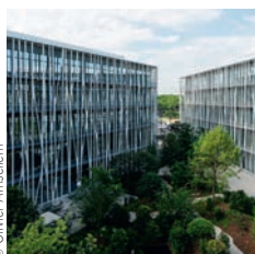
Architecte - Rudy Ricciotti

VINCI Construction France - Petit Maison de l'Avocat, Paris (XVII e )