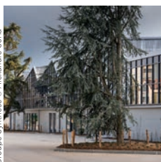
Architectes : Greig & Stephenson / Groupe Synthese

Fayat Bâtiment Île-de-France Manufacture de la Mode, Aubervilliers