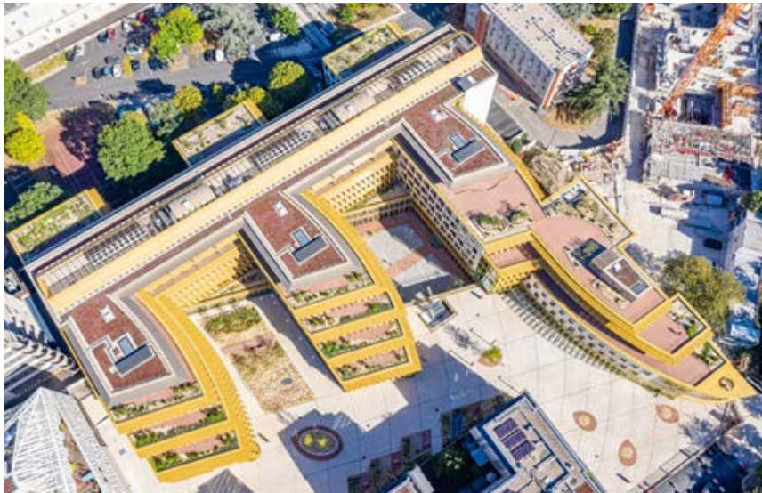
Architectes : Goes Peron

L'ensemble de bureaux Floresco est composé de trois bâtiments de bureaux. Conçu et exécuté en full BIM cet ensemble immobilier compte 14 000 m 2 de façades hétérogènes et techniques, comprenant des blocs vitrés, des murs rideaux, du bardage, des châssis, des consoles support de brises soleil. Les bâtiments disposent de plus 6 500 m 2 de terrasses aménagées et sont multi-labélisés : certification NF HQE Excellent, certification Breeam International niveau Very Good, Label Effinergie+ Niveau Très performant, label Accessibilité niveau 1, etc. L'ensemble de bureaux a été livré en mai 2020 en pleine pandémie Covid, sans aucun retard.