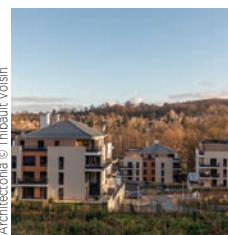
Architectonika © Thibault Voisin

Leon Grosse Complexe sportif Alain Mimoun Rueil-Malmaison