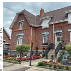
Architecte : Ingibat © TDR

Léon Grosse Cité Heurteau, réhabilitation de 153 maisons individuelles