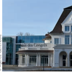
Architecte : Wilmothé & Associés

Sogea Picardie Op'n Work bureaux pour la Sanef, Senlis