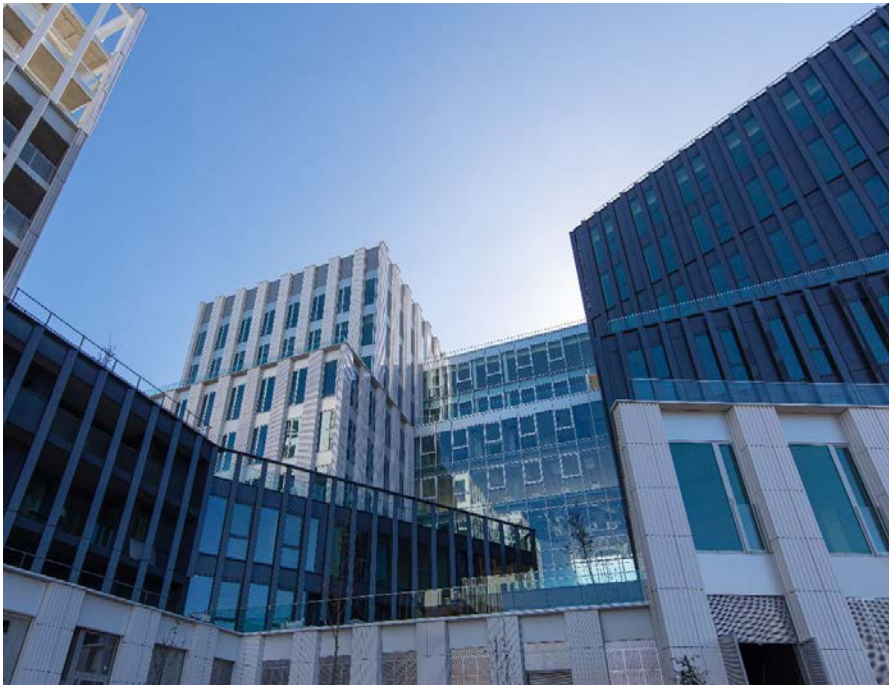
Architectes : Tag Architectes

O opération mixte de conception et réalisation mêlant le siège social de Partenord Habitat, des bureaux, des logements sociaux, des commerces et des places de stationnement en sous-sol. Les architectes, le BET et l'entreprise générale ont été associés dès la phase de conception à ce projet complexe. Afin de respecter le timing très serré du projet, l'entreprise a mis en place la méthode Lean et exploité la maquette numérique à tous les stades du projet. Pour réduire l'impact environnemental du bâtiment, des systèmes novateurs ont été installés, tels que des radiateurs numériques, des panneaux photovoltaïques, de la récupération d'énergie sur l'air extrait et les eaux grises et la récupération de l'énergie fatale des bureaux pour chauffer gratuitement les logements. L'opération a, de surcroît, dépassé l'objectif contractuel d'insertion avec un total de 14 513 heures réalisées.