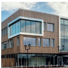
biaq © Architectures

Bougyes Bâtiment Nord-Est Les Tuileries, 339 logements, Roubaix