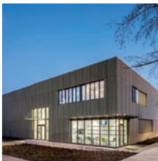
Architecte : Transform

Sogea Picardie Op'n Work bureaux pour la Sanef, Senlis