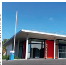
Architecte : Barbosa Vivier

Eiffage Construction Bureaux Agapes Restauration, Lézennes