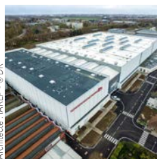
Architecte : JAREP