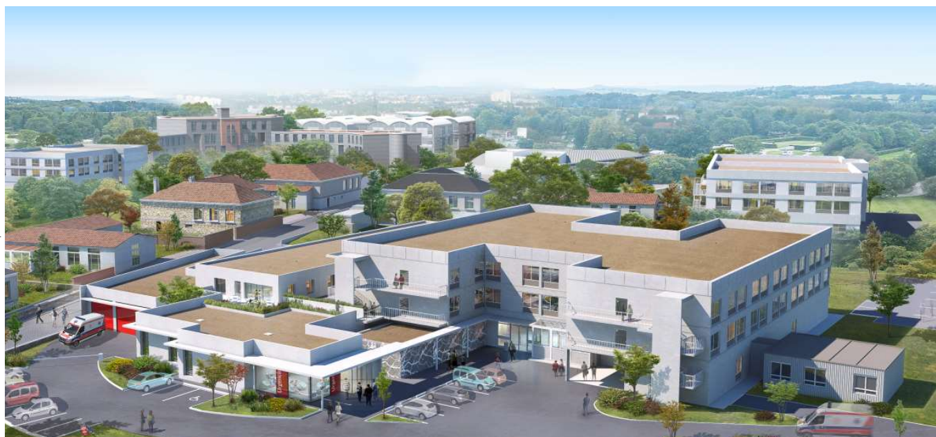
Architectes : Barbosa Vivier Architectes

La création du nouveau service des urgences de l'Hôpital de Clermont de l'Oise est une opération réalisée en conception-construction. D'une durée de 21 mois (dont 13 mois de travaux), le projet comprenait une extension dans le prolongement de l'hôpital existant, un service d'urgences et la modernisation des services et appareils techniques de l'hôpital, la revue complète du système SSI et l'ajout d'un laboratoire.