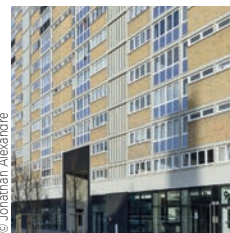
Rédact, Trace Architecte, Archiade

Spie batignolles Nord Palais des Congrès du Touquet