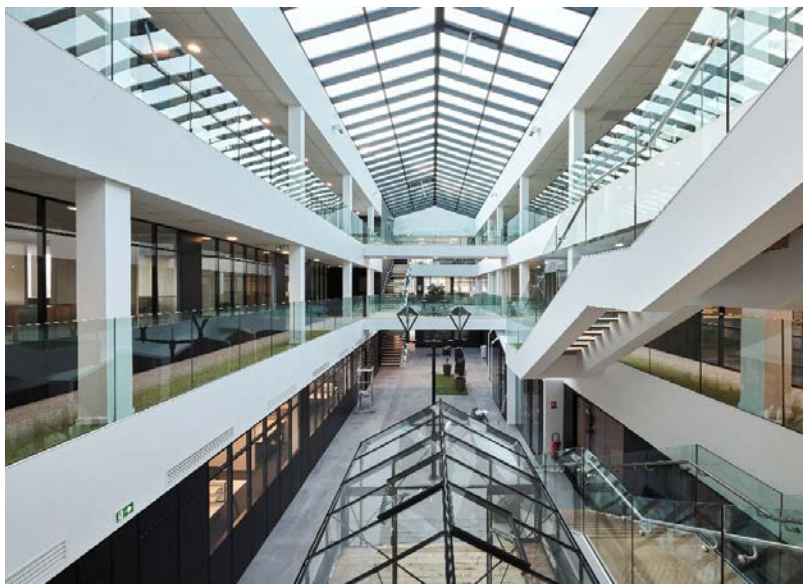
Architectes : Blaq® Architectures