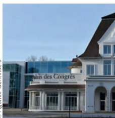
Architecte : Wilmotte & Associés © Agence Identifiable

Sogea Picardie Op'n Work bureaux pour la Sanef, Senlis