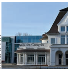
Architecte : Wilmotte & Associés

Sogea Picardie Op'n Work bureaux pour la Sanef, Senlis