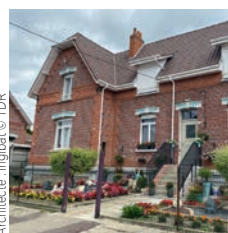
Architecte: Inglibat

Léon Grosse Cité Heurteau, réhabilitation de 153 maisons individuelles