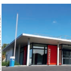
Architecte : Barbosa Vivier

Nord France Constructions Tripolis, bureaux, commerces et logements Partenord Habitat, Lille