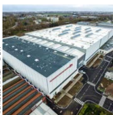
Architecte : IAREP