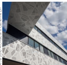
Eiffage Construction CHRU de Brabois, Nancy

Art & Build Architecture