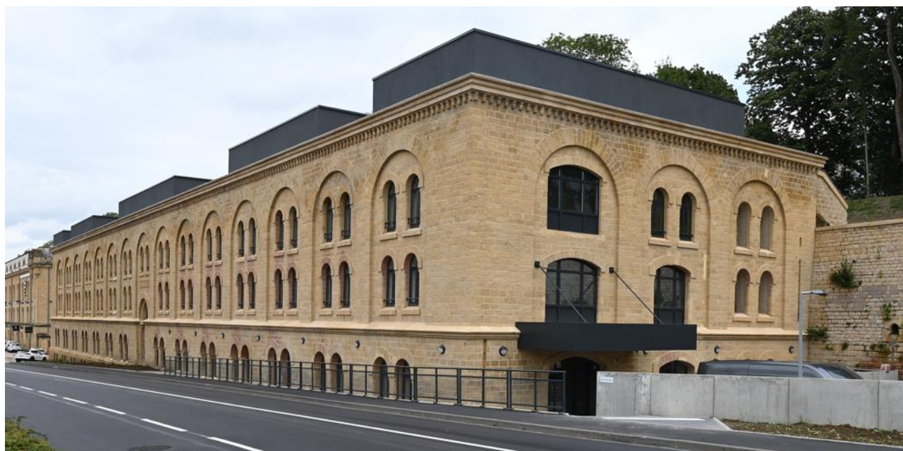
Architectes : GF Architecture

La réhabilitation de l'ancienne caserne Steinmetz constitue un bel exemple de reconversion du patrimoine militaire pour l'urbanisme local. Construit entre 1878 et 1880 et faisant partie du patrimoine messin, le bâtiment a été transformé en résidence étudiante. L'opération, réalisée en entreprise générale, avait pour principal défi le maintien des façades moellons classées et la restauration des façades en pierre de Jaumont. L'entreprise générale a travaillé en étroite collaboration avec les architectes d'intérieur pour la décoration et la conception des mobiliers. Le tri et la valorisation des matériaux issus de la démolition ont permis de les réemployer sur d'autres chantiers à proximité. 100% des entreprises partenaires et sous-traitantes étaient régionales et locales.