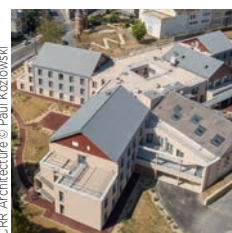
Spie batignolles Ehpad Roland Garros, Vouziers