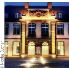
Urban Dumez Hôtel Nuée Bleue, Strasbourg

Architectes : DJACC / AEA