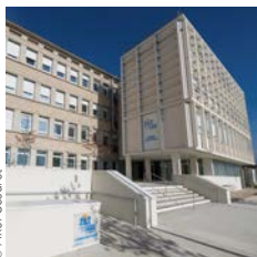
Demathieu Bard Clinique médico-pédagogique de Vitry-le-François

Architecte : Vallet de Martinis