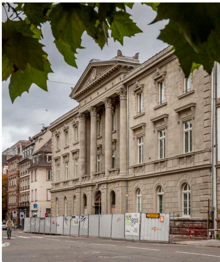
Architectes : DTACC / AEA

Thierry Lazaro , Liebermann (Plomberie/sanitaire)