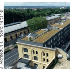
GF Architecture © Frédéric Mercenier

Spie batignolles Ehpad Roland Garros, Vouziers