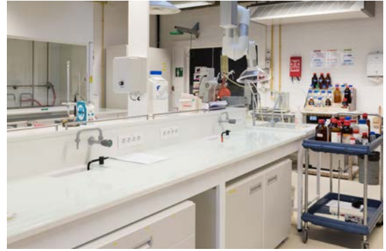
Architectes : Patriarche &amp; Co