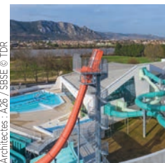
Architectes : A26 / SSSE

Bouygues Bâtiment Sud-Est Campus Région du numérique, Charbonnières- les-Bains