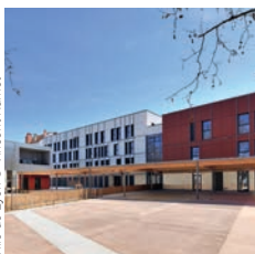
Ville de Lyon © Vincent Ramet

Spie batignolles Centre aqualudique de Valence