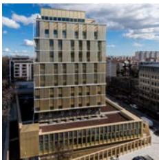
Architectes : Atelier 213/4, Barbanel, Alto ingénierie

Léon Grosse Restructuration du siège social de la Carsat, Lyon