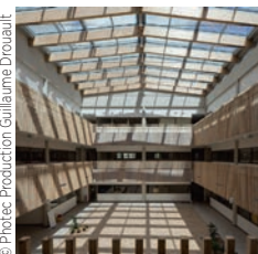
Architectes : TJ Archi

Eiffage Construction Groupe scolaire Julien Duret, Lyon