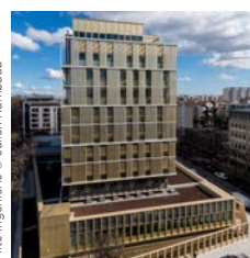
Architectes : Atelier 213/4, Barbanel, Alto ingénierie

Léon Grosse Restructuration du siège social de la Carsat, Lyon