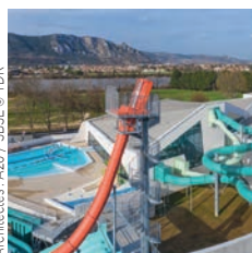
Architectes : A26 / SBSE

BLB Constructions Réhabilitation de l'École normale supérieure, Lyon