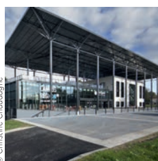
Architecte : Wilimote et associés

Léon Grosse Siège social de Michelin, Clermont-Ferrand