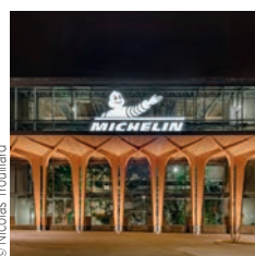
Architecte : Ericoneheureux

Léon Grosse Siège social de Michelin, Clermont-Ferrand