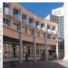
Architecte : Patriarche et Co

Spie batignolles Bâtiment Atrion pour Elkem silicones, Saint-Fons