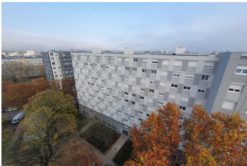
Architectes : Bbc, Ishaques, Wra, Atelier 127