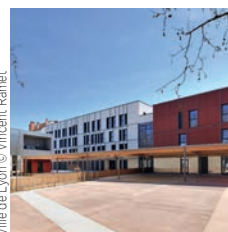
Ville de Lyon

Spie batignolles Centre aqualudique de Valence