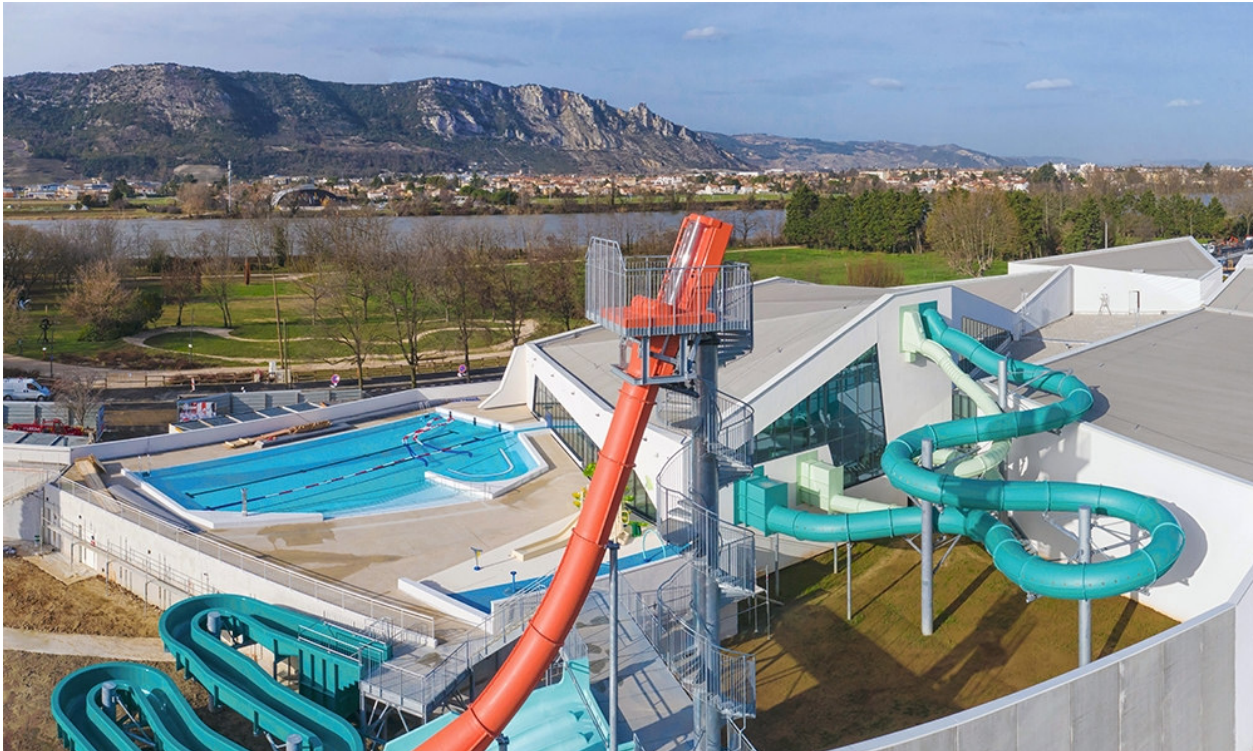
Architectes : CET, Etamine, Burgeap, Cogeci

Conçu et construit en un temps record (2 ans) via une délégation de service public, le centre aqualudique de l'Épervière, à Valence, associe esthétique architecturale, maîtrise énergétique et innovation financière. Spie batignolles s'est allié avec le cabinet d'architecture A26 et les bureaux d'études CET Ingénierie et Etamine pour répondre aux contraintes du projet (zone sensible et inondable ; performances énergétiques ambitieuses, confort d'exploitation de ses trois univers - enfants, balnéo, sportif). La réalisation de ce centre aqualudique, particulièrement intégré à son environnement naturel, a mobilisé 90 entreprises de la région.