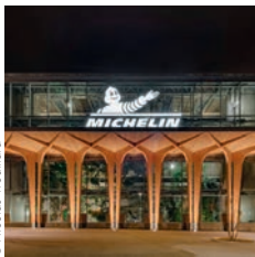
Léon Grosse Siège social de Michelin, Clermont-Ferrand