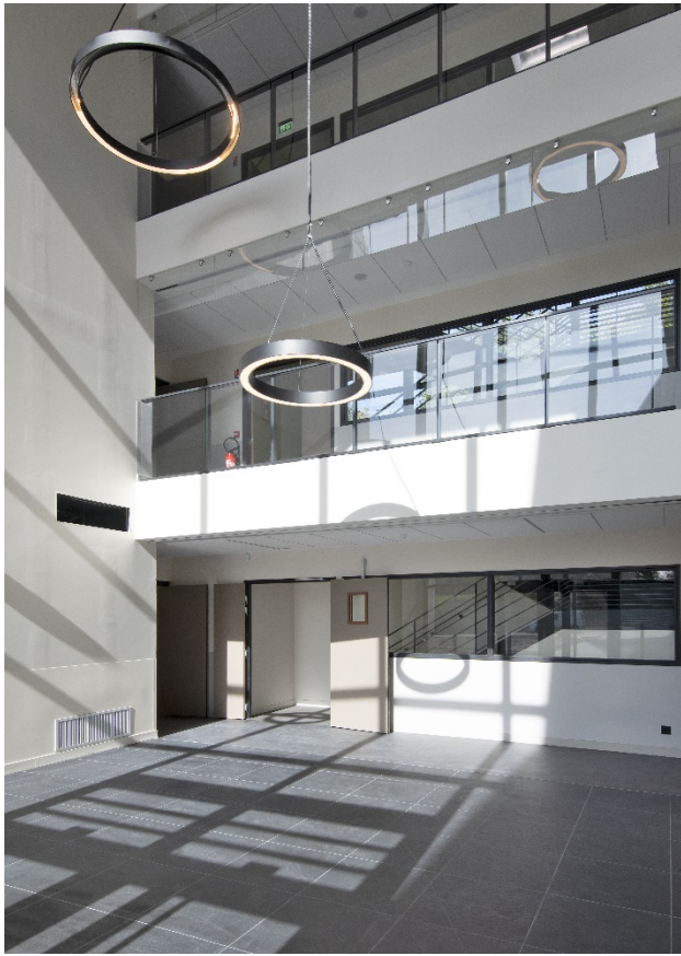
Architectes : Wilmotte & Associés