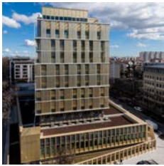
Léon Grosse Restructuration du siège social de la Carsat, Lyon