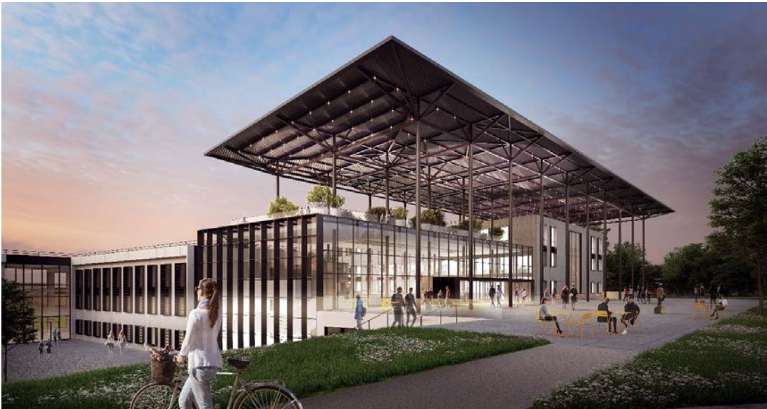
Architectes : Wilmotte & Associés

O opération de réhabilitation de quatre bâtiments et de construction d'une agora au sein du nouveau Campus Région du Numérique. Réalisé en partenariat avec l'architecte Wilmotte & Associés, le site est destiné à accueillir et rassembler les acteurs du numérique sur l'emplacement de l'ancien siège de la Région à Charbonnières-Les-Bains. 1500 étudiants et professionnels y sont accueillis.