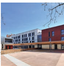
Eiffage Construction Groupe scolaire Julien Duret, Lyon