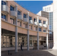
BLB Constructions Réhabilitation de l'École normale supérieure, Lyon