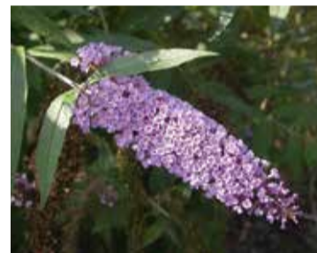
Arbre aux papillons, Buddleja davidii