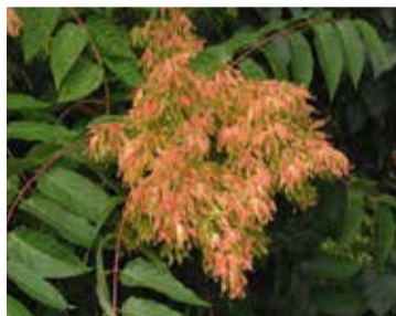
Ailante glanduleux, Ailanthus altissima