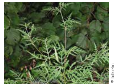
Ambrosie à feuilles d'armoise, Ambrosia artemisiifolia