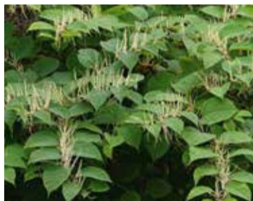
Renouée du Japon, Reynoutria japonica