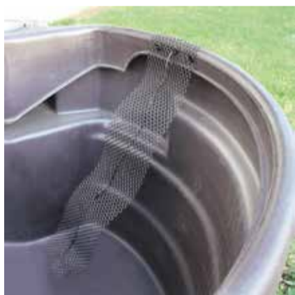
Échappatoire, le géotextile placé sous la grille permet de préserver la géo membrane du bassin

■ s'ils appartiennent au service public (poteaux téléphoniques, poteaux de signalisation), relever l'éventuel numéro inscrit dessus et informer le maître d'ouvrage qui contactera le service concerné ;