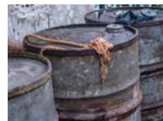
Fuites de polluants accidentelles : barils d'hydrocarbure