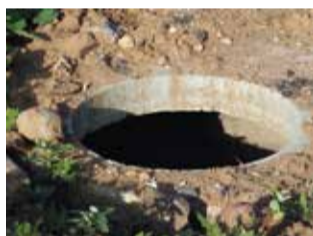
Trou au ras du sol : regard d'égout, système d'irrigation