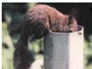
Poteau creux : une fois rentré, l'écureuil ne pourra plus ressortir