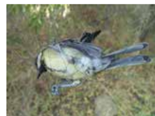
Filets, fils, cordelettes : oiseau piégé dans un filet