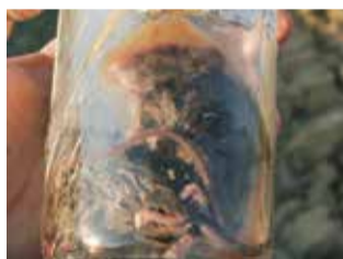
Bouteilles et canettes : souris mortes dans une bouteille