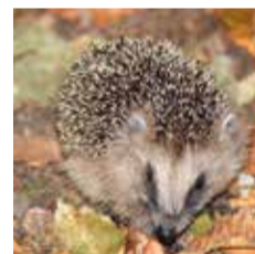
Mamifères terrestres (ici, hérisson d'Europe)