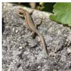
Reptiles (ici, lézard des murailles)