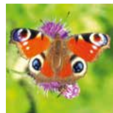
Insectes (ici, paon-du-jour)