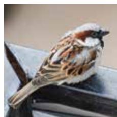
Oiseaux (ici, moineau friquet)