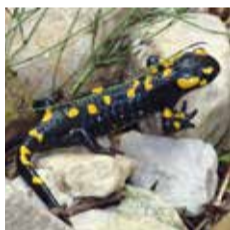
Amphibiens (ici, salamandre tachetée)