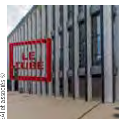
Architecte : Carta Associés, Tangram EAI et associés ©