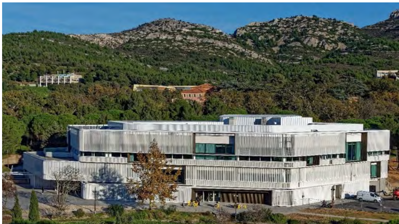
Rémy Marciano Architecte

Provence-Alpes-Côte d'Azur - Ouvrage fonctionnel