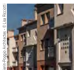
Vierini-Poggio Architectes