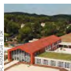
CFL Architecture