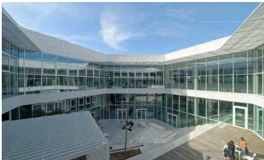
Rémy Marciano Architecte