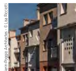
Bouygues Bâtiment Sud Est Bâtiment Hexagone sur le campus Luminy, Marseille

Vierini-Poggio Architectes