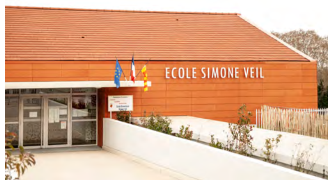
Vierrin-Poggio Architectes