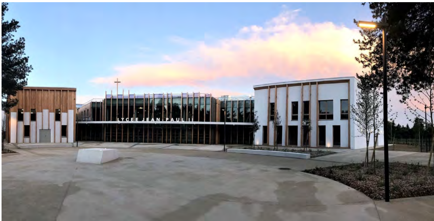
Architectes: CLCT